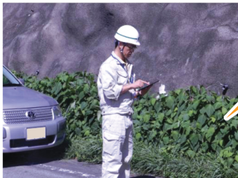
データを整理する作業が短縮され、パトロールに集中。