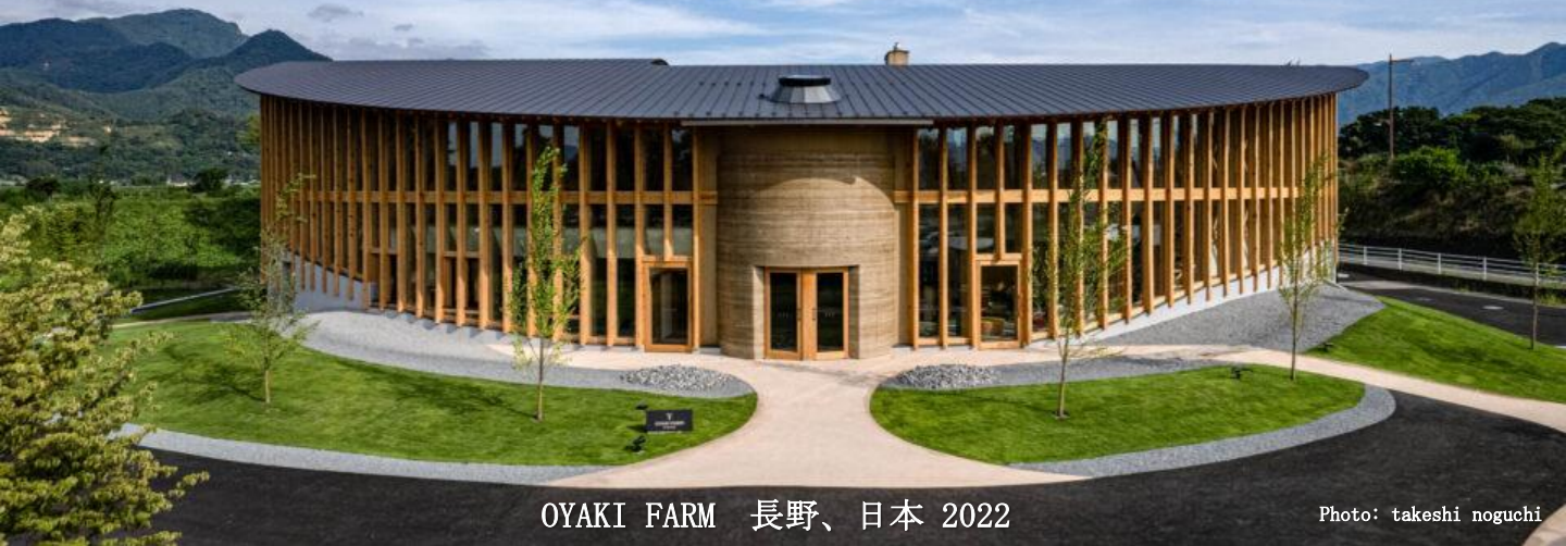
OYAKI FARM 長野、日本 2022