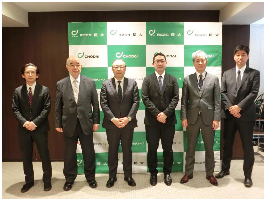
▲協定書調印後の全体写真