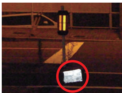
夜間、ライトの光を明るく反射する様子