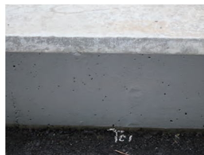
塗布後、目立ちにくい色